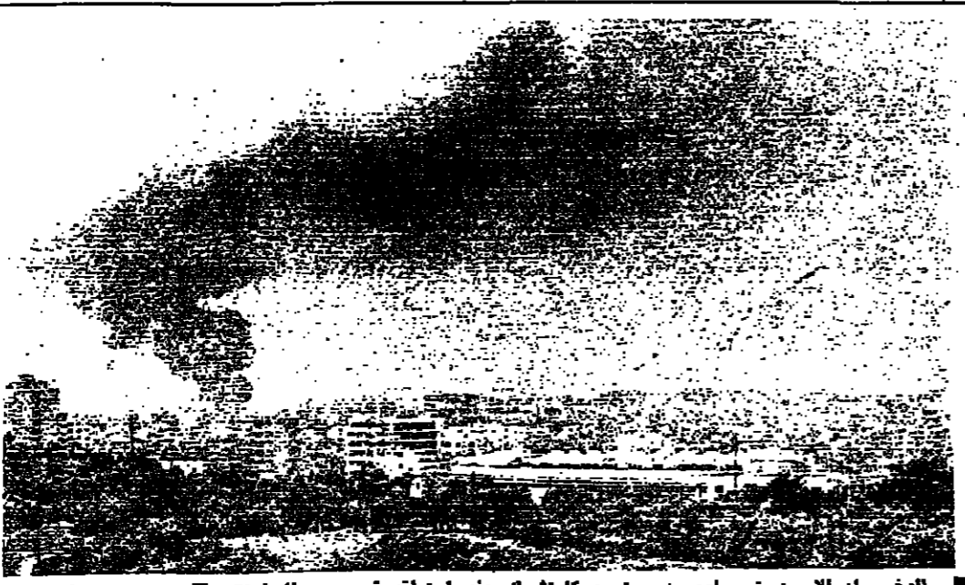
الدخان الأسود ينضاد من مستودع كاثوليك عند اختراقه قرب برج البراجنة

نهار صاروخي طويل في الدكوانة وقد استمرت الاشتباكات اليوم في الدكوانة ، حيث تم قتل 25 شخصا ، وجرى تبادل الاتهام بين الجانبين . وقد استمر القتال حتى الساعة العاشرة مساء ، ثم توقف عن العمل . وقد تم تبادل الاتهام بين الجانبين ، حيث اتهم الجانب الإسرائيلي بقتل 15 شخصا ، والجانب الفلسطيني بقتل 10 أشخاص . وقد تم تبادل الاتهام بين الجانبين ، حيث اتهم الجانب الإسرائيلي بقتل 15 شخصا ، والجانب الفلسطيني بقتل 10 أشخاص . وقد تم تبادل الاتهام بين الجانبين ، حيث اتهم الجانب الإسرائيلي بقتل 15 شخصا ، والجانب الفلسطيني بقتل 10 أشخاص .